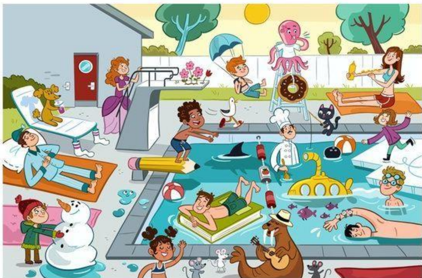
Silly Swim Client: Highlights Puzzlemania