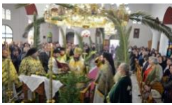
Η Θεία Λειτουργία της Κυριακής των Βαΐων.