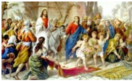
Η υποδοχή του Ιησού στα Ιεροσόλυμα.

Το βράδυ της Κυριακής κλείνουν τα φώτα στον ναό και ο ιερέας μεταφέρει στο κέντρο του ναού την εικόνα του Νυμφίου Χριστού, για να την προσκυνήσουν οι πιστοί. Θυμούνται, έτσι, όλοι πως πρέπει να είναι πάντοτε προετοιμασμένοι να υποδεχτούν τον Χριστό στη ζωή τους.